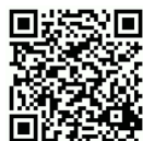
B360 3D demo